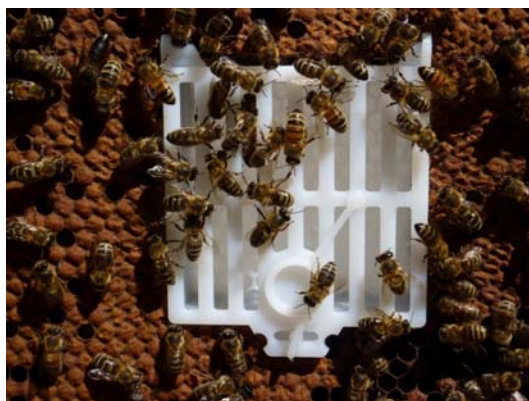
Käfig (Vortrag Sauter an der GV des Buckfastimkervereins am 2. Februar 2013, http://www.buckfastimker.ch/de/artikel.htm )

Als Hilfsgerät wird Käfig aus Kunststoff-Absperrgitter verwendet. Dieses wird am besten im Frühjahr gleich in eine Brutwabe mit Mittelwand eingebaut (Bannwabe), um nicht durch unnötiges Platz schaffen Brut zu vernichten. Es gibt mehrere Modelle des Käfigs (erhältlich vor allem in Italien). Gemeinsam ist allen, dass die Königin eingeschlossen ist, die Bienen aber ungestört durchs Gitter hindurch und so die Königin pflegen können.