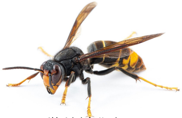
Abb. Asiatische Hornisse